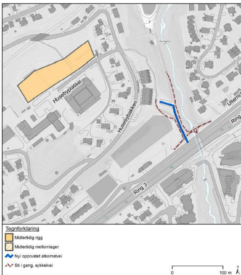
Figur 1: Omsøkt løsning for riggområder og gang- og sykkelvei fra Statnetts konsesjonssøknad av mai 2015

Statnett søkte konsesjon om Fornyelse av kabelforbindelsene Smestad-Sogn og Smestad transformatorstasjon i mai 2015. Søknaden ligger til behandling hos NVE. I forbindelse med detaljering av anleggsarbeidet er det kommet opp behov for å utvide riggområdet og anleggsveier ved Makrellbekken på Smestad i forhold til det som ble beskrevet i konsesjonssøknaden.