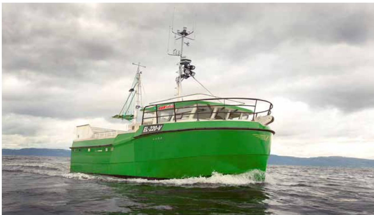
DEN ELEKTRISKE FISKEBÅTEN «KAROLINE».