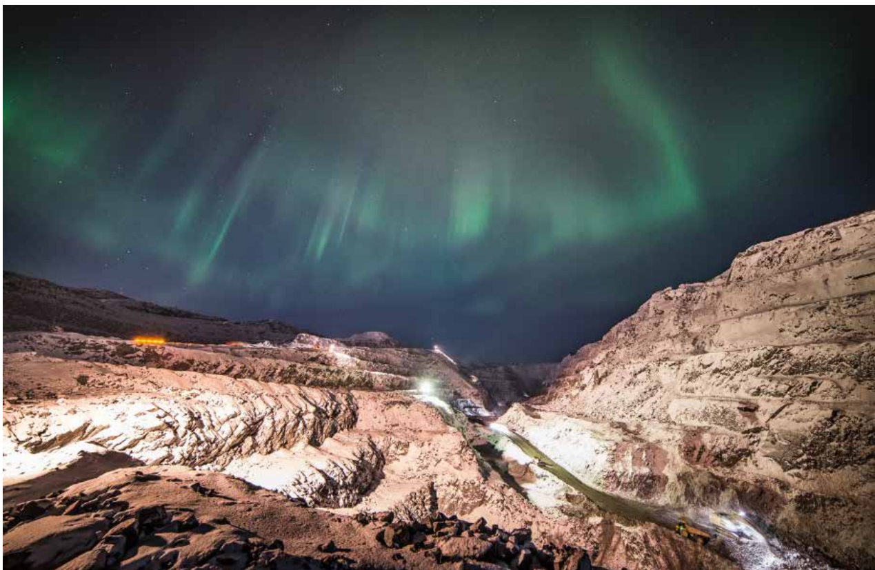
JERNMALMGRUVENE I KIRKENES. FOTO: SYDVARANGER

er at forventet forbruksøkning i Hammerfest gjør det mulig å mate inn mer ny vindkraft i Øst-Finnmark, og at kostnadene for nødvendige netttiltak er lavere enn før. Nettkostnaden per MW vindkraft blir da betydelig lavere enn før. Som konsekvens av de oppdaterte vurderingene, har Statnett trukket søknaden til NVE om dispensasjon fra tilknytningsplikten for den konsesjonsgitte vindkraften på Varangerhalvøya.