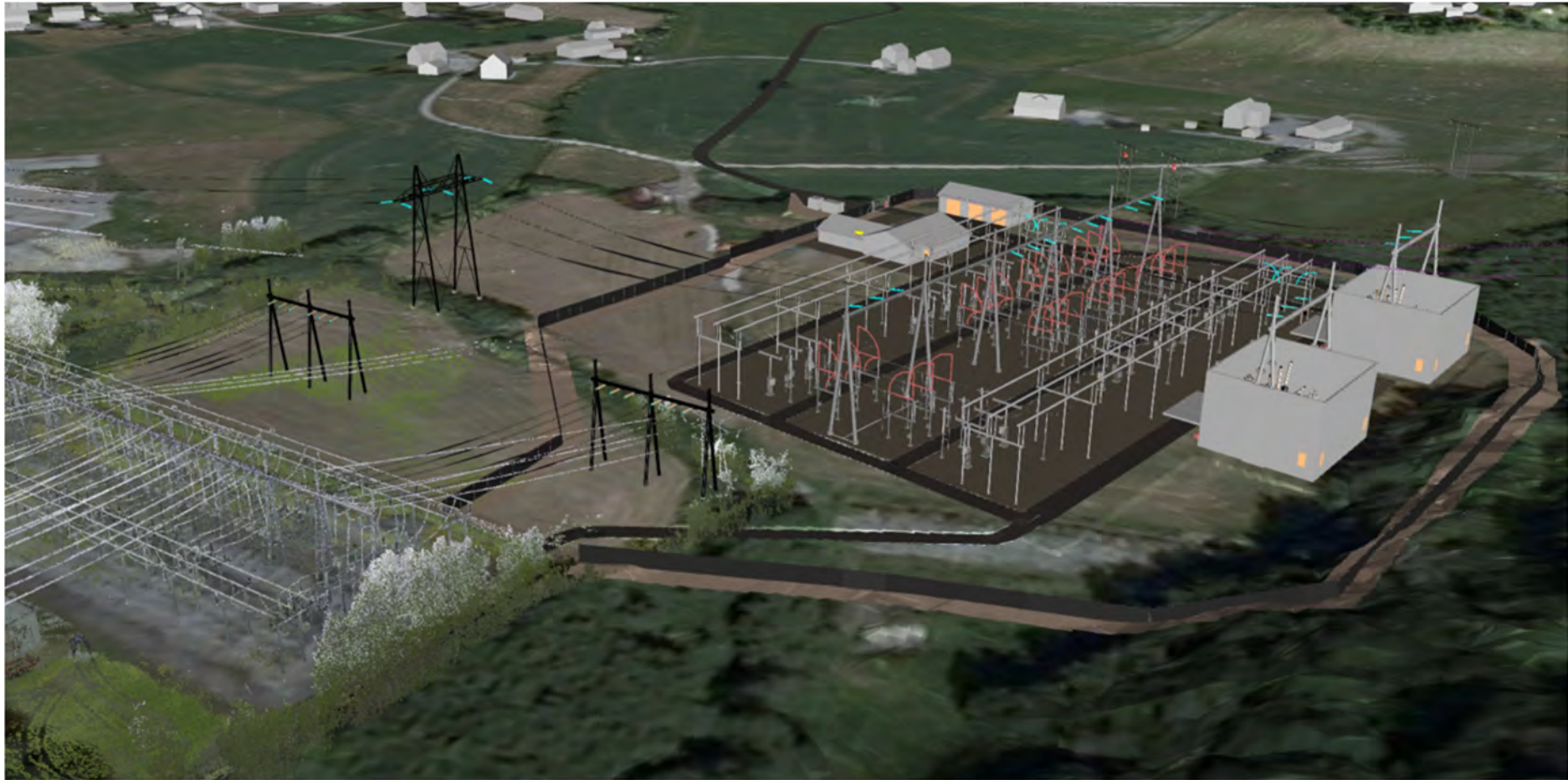
Planlagt stasjon sett fra sørøst.