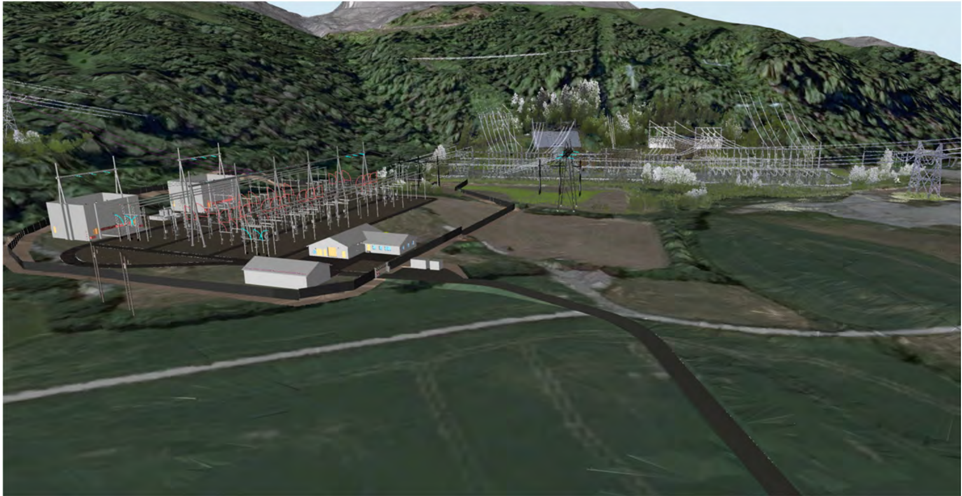
Planlagt stasjon og eksisterende stasjon sett fra nord. Ny adkomst som mørk grå strek i forkant.