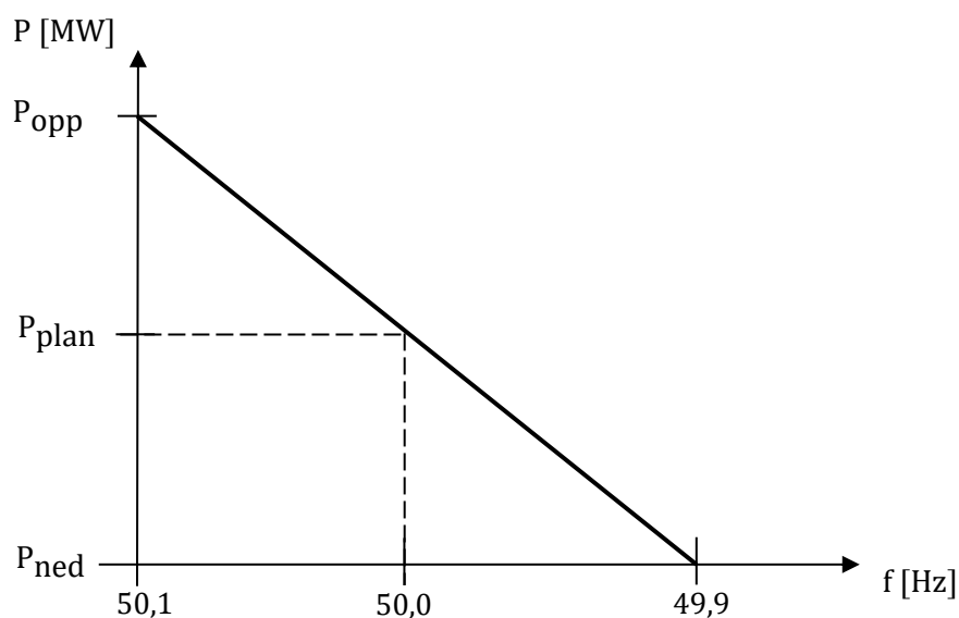
Figur 3 Stasjonær effekt som funksjon av målt frekvens. (Figur oppdatert)

I Figur 3 under illustreres hvordan forbruk P_{plan} korrigeres som funksjon av målt frekvens. Ved en endring av frekvens fra 50,0 Hz til 49,9 Hz reduseres forbruket iht. til innmeldt systemdata (FCR). Ved en endring av frekvens fra 50,0 Hz til 50,1 Hz økes forbruket iht. til innmeldt systemdata (FCR).