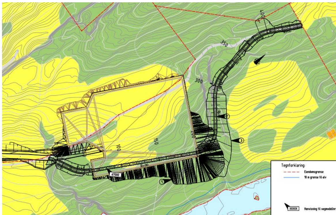
Figur 2 - vist på vedlegg 2 - veiløsning som ligger på fylling på utsiden av gjerdet til transformatorstasjonen