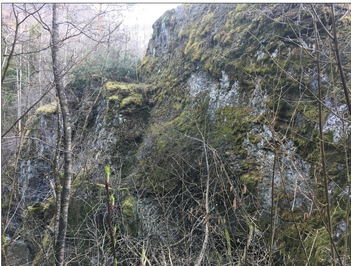
Figur 5 Øvre deler av kløfta, sett oppe fra sørsiden av den og mot nordvest. Selv om selve kløftverdiene går tapt ved en utfylling, anbefales det å holde bergvegger og bergflater inntil mest mulig intakte og åpne, da slike utgjør kvaliteter i seg selv.

Som kompensierende tiltak er kanskje det mest relevante å permanent fjerne innslag av plantet gran i tiltaksområdet, og gjerne også andre steder, der grana står i berglendt, glissen skog som her.