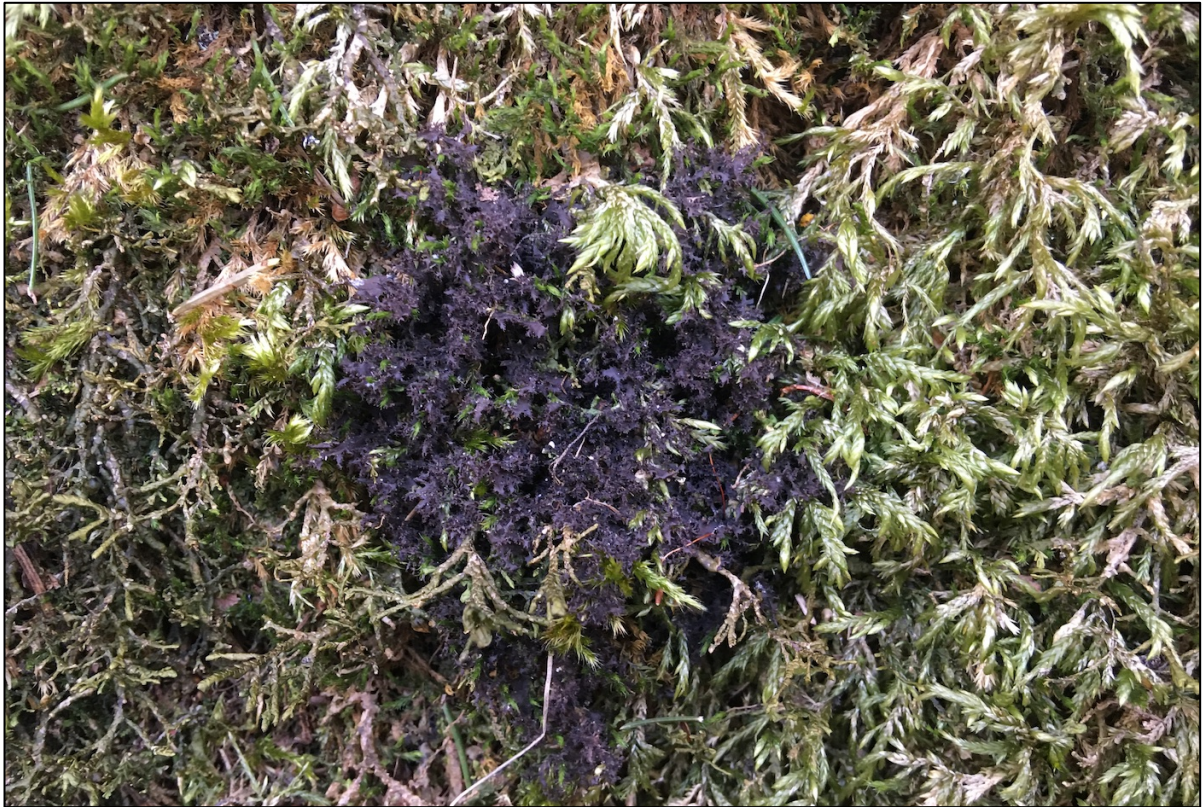
Figur 2 Ei lita tue med flishinnelav Scytinium lichenoides på berget i nedre deler av kløfta. Arten indikerer svakt kalkrike bergvegger og er noe fuktikrevende, men såpass utbredt i Norge at den bare er en svak indikator på verdifulle miljøer.

Heller ikke for moser ble annet enn svake indikatorarter for verdifulle miljøer påvist. Både levende og døde trær var gjennomgående for unge til å finne aktuelle rødlistearter, som stammesigd (NT – som også vanligvis vokser på lind) eller fakkeltvebladmose (VU – på fuktig og morken ved). På berg vokser flere arter knyttet til intermedieære til svakt kalkrikt berg, som flatfellmose, glansperlemose, putevrिमose og gulband. Derimot var det tydelig fravær av arter som krever temmelig til sterkt kalkrik mark, og det er i første rekke på det nivået mulige rødlistearter kunne dukket opp, som ulike arter blygmose ( Seligeria spp.).