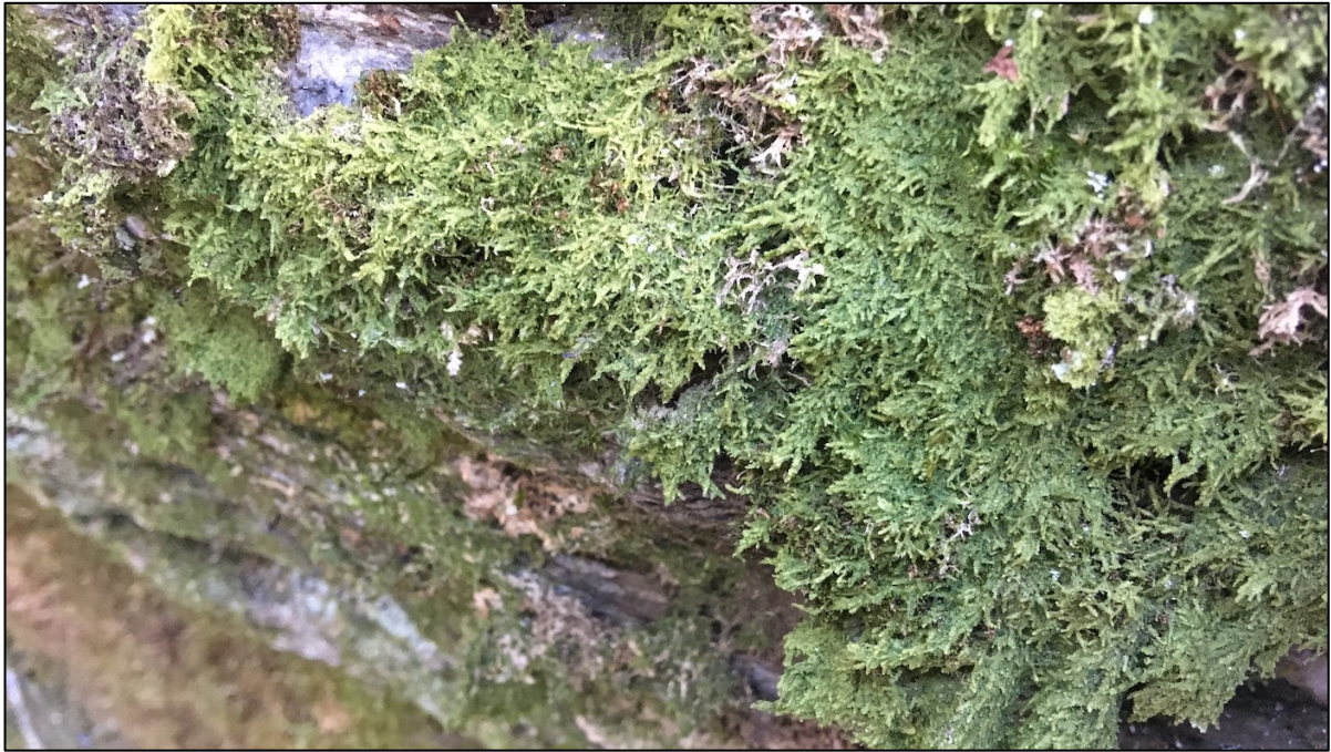
Figur 3 Glansperlemose Lejeunea cavifolia og flatfellmose Neckera complanata på bergvegg i kløfta. Artene ble funnet flere steder her og må regnes som svakt kalkkrevende og samtidig noe fuktkrevende. De er likevel utbredt i Norge og bare svake indikatorer på verdifulle miljøer.