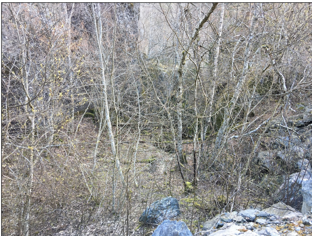
Figur 6 Ganske ung lauvskog i øvre deler av kløfta, sett fra landbruksvegen på oversiden. Vegen har ikke direkte påvirket kløfta, men litt stein har blitt liggende ned mot den og vegen har ført til en skarp overgang mot sterkt endret mark mot oversiden.

Henriksen, S., & Hilmo, O. 2015. Norsk raudliste for artar 2015. Artsdatabanken, Norge.