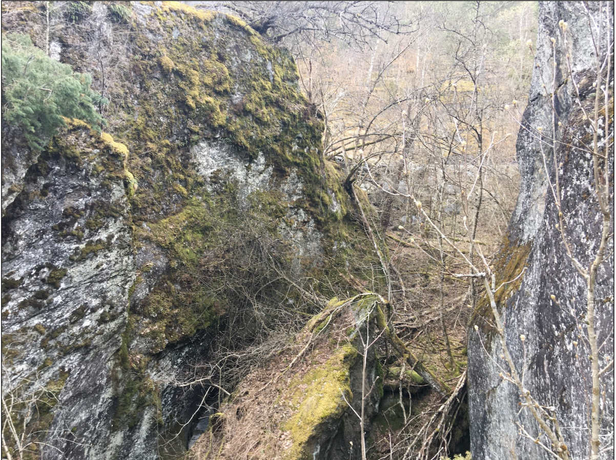
Figur 4 Øvre deler av kløfta, sett oppe fra nordsiden av den og mot vest. Bergveggene er moseklede og vitner om et nokså stabilt lysåpent og samtidig fuktig miljø. Dette er potensielt godt egnede leveområder for kravfulle og også rødlistede lav, men ingen slike ble observert. Årsaken er uklar, men kanskje har ikke miljøet vært like stabilt tidligere, kanskje er ikke berggrunnen optimal og/eller lokaliteten ligger for isolert til for etablering av slike arter.